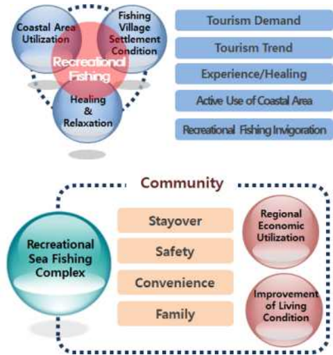
Fig. 1 Concept of recreational sea fishing complex

가족중심의 바다낚시인에게 다양한 레저, 숙박, 안전, 편의를 제공하고 어촌지역 경제 활성화와 삶의 조건 개선을 목적으로 조성하는 해양복합공간이다.